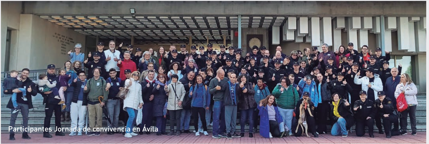
Participantes Jornada de convivencia en Ávila