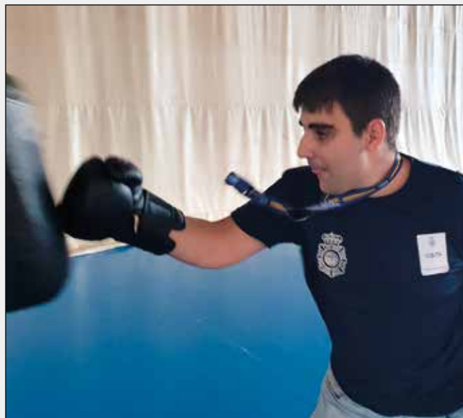
"Entrenando con un policía Nacional".

En diciembre pudimos ir a la Academia Nacional de Policía. Donde me lo pase ¡Genial!