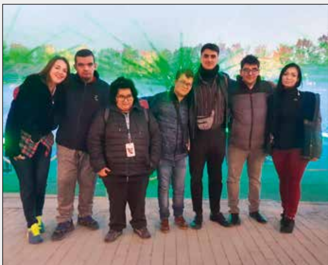
"Mi grupo del club de ocio."

En resumen, el club de ocio me parece algo muy bonito, porque he tenido muchas oportunidades de conocer no solo distintas zonas de Madrid, sino que también he conocido gente con discapacidades distintas a la mía y he podido aprender muchas cosas sobre los distintos tipos de discapacidad que hay en el mundo.