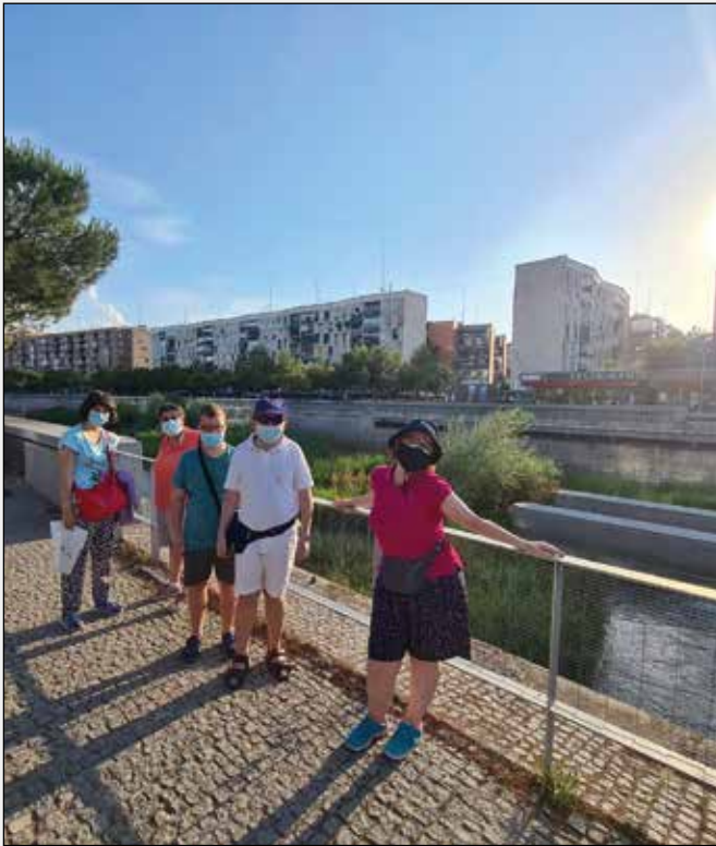
Participantes del Club de Ocio de Amifp en la actividad de Madrid Río

y cultural cerca del Río Manzanares. Si te interesa participar en el Club de Ocio de Amifp, no dudes en ponerte en contacto con nosotros.