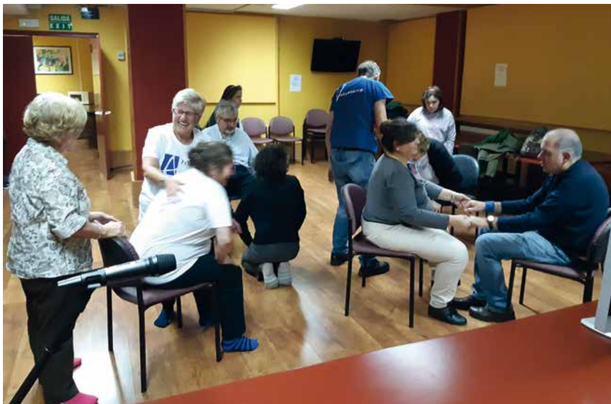
Un grupo de participantes durante el curso de Teatro Terapéutico

Como ejercicio, propusimos una consulta al médico. Imaginense. La sala de espera atestada, llena de pacientes con sus cosas por hacer, sus prisas y sus llantos, sus quejas, sus cosas..., sus vidas en un puño. Donde se espera hubiera de haber un/a doctor/a, alguien propuso saber si había.