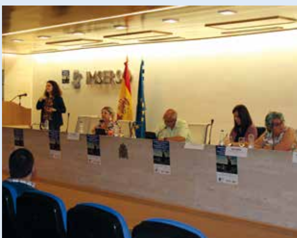
Ponentes participando en las Jornadas 2019

Por todo ello y por la importancia de este fenómeno, desde Amifp decidimos organizar nuestras pasadas Jornadas de junio en torno al tema del envejecimiento enmarcado en el ámbito de la discapacidad dentro del contexto de la inclusión.