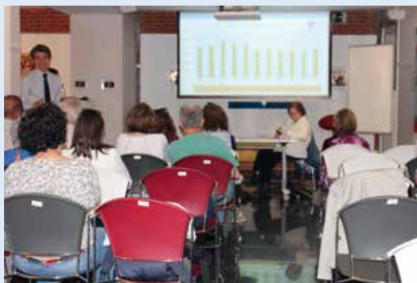
Asamblea de Amifp 2019

En el mes de junio tuvo lugar la Asamblea General de Amifp. El sitio elegido fue el Espacio Pozas 14. Como cada año y siguiendo nuestros criterios de Transparencia