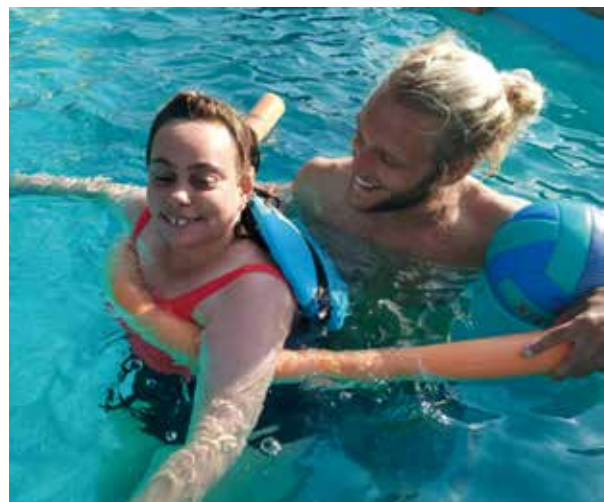
Usaria de Fundamifp junto a un trabajador en la piscina

- Favorecer la diversión y disfrute de las vacaciones de los usuarios mediante actividades de ocio.