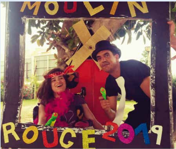
Fiesta de disfraces temática "Cabaret" en Fundamifp