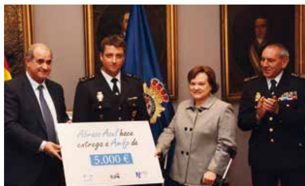
Asistentes al acto del congreso.