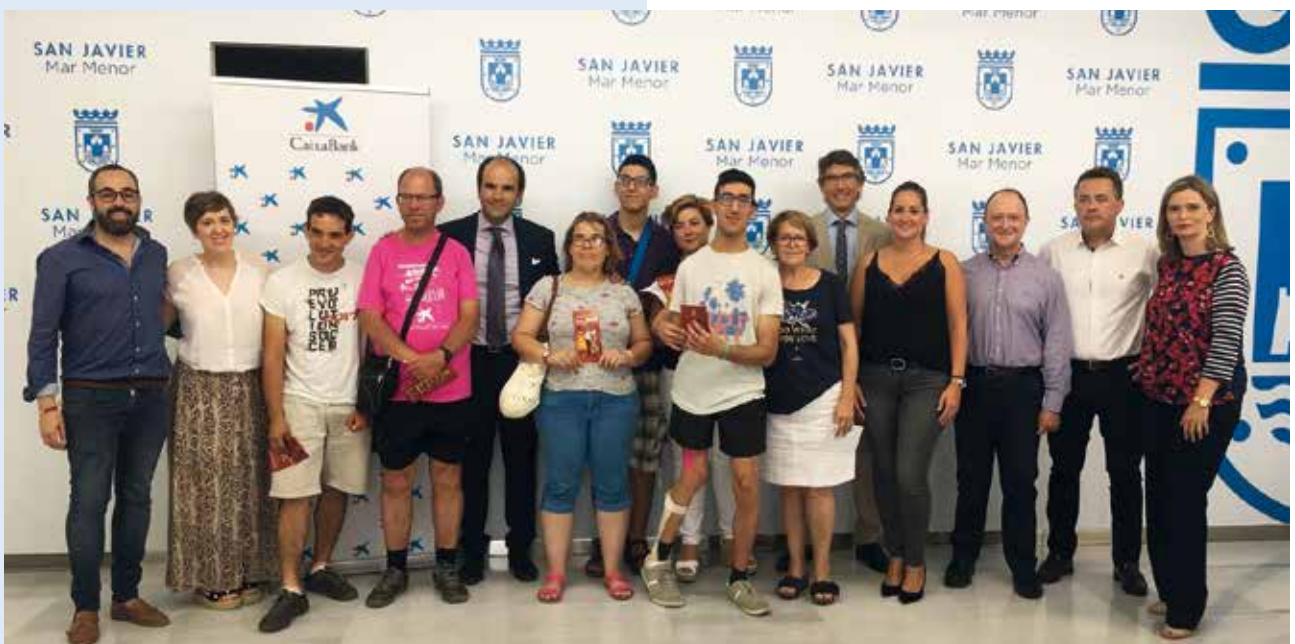
Miembros de Fundamifp posan con sus entradas del festival de Jazz