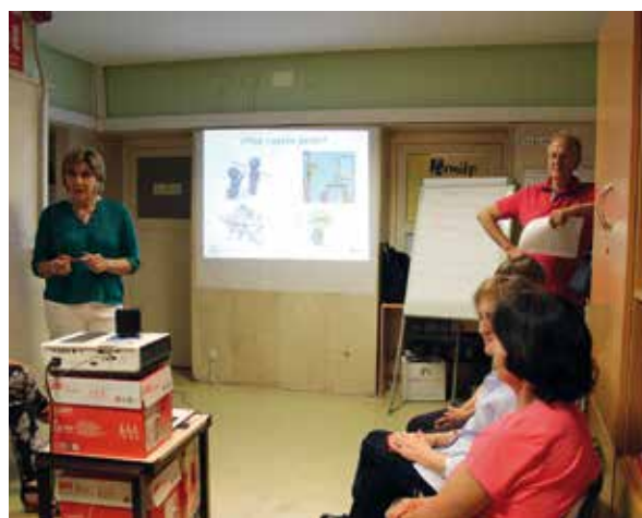
Asistentes al curso de coaching con los formadores en la sede de Amifp

Dirigido a dar pautas que ayuden a potenciar el bienestar del cuidador, hemos chequeado los avances a nivel personal que han obtenido los asistentes de estas últimas ediciones. Al adentrarnos en el contenido de este curso, podemos apreciar cómo la importancia de cuidarnos para poder cuidar es sumamente fundamental. Orientado a cuidadores de primer orden y familiares de personas con discapacidad, se focalizó en dinámicas de role plays y ejercicios de corporalidad así como en la importancia de la auto escucha y el cuidarse a uno mismo. ¡De nuevo esta sesión de coaching ha tenido una excelentísima acogida!