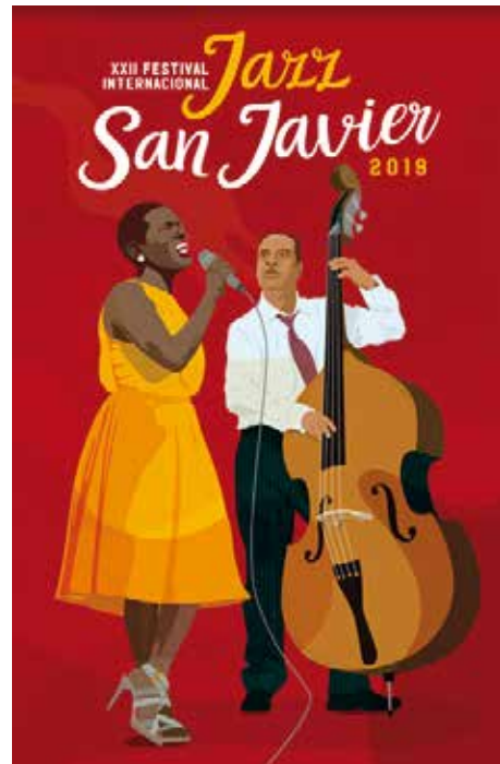
Cartel del festival de Jazz