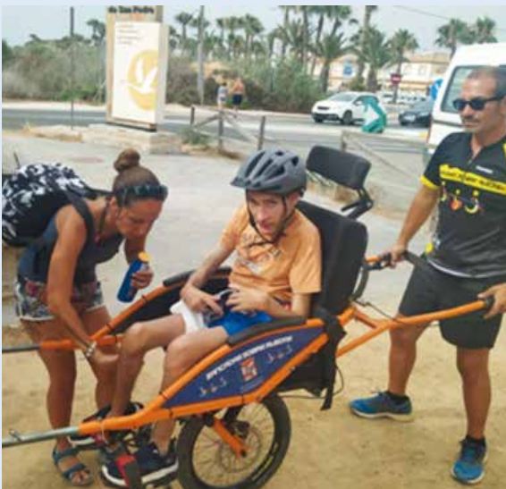
Foto: Asociación Zancadas participa con Fundamifp en las rutas senderistas adaptadas en Salinas de San Pedro del Pinatar. Murcia.