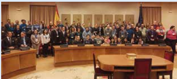
Asistentes al acto del congreso.

El 18 de febrero estuvimos presentes en el Congreso de los Diputados con motivo de apoyar a Aura Fundació y Fundación Síndrome de Down de Madrid en la lectura del Manifiesto Empleo . Se trata de un documento que recoge las pautas necesarias para lograr una situación de empleo "digno" y remunerado en empresas ordinarias para todas las personas con discapacidad. El acto estuvo presidido por la antigua presidenta de esta Cámara, Ana Pastor. Las diferentes entidades que realizaron su ponencia expusieron sus puntos para que a este colectivo se le reconozca como trabajadores y se eliminen los prejuicios existentes. Además, se pidió la tan necesaria "normalización" laboral y se habló de las mejoras y beneficios obtenidos tanto para la empresa como para los propios trabajadores de los programas. Aura Fundació es una entidad sin ánimo de lucro que nació primero como asociación y desde el 2004 actúa como fundación. Ha sido el primer programa de "Empleo con Apoyo" en España, pionero en la implantación y desarrollo de esta metodología.