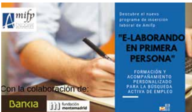
Cartel promocional del curso E-laborando.

Todo esto va tomando forma a través de una metodología basada en un proceso de asesoramiento y orientación. Aquí el coaching actúa como un apoyo constante a las personas para conseguir los objetivos específicos y su consecuente empoderamiento, tanto personal como laboral.