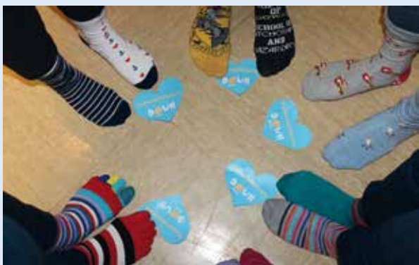
Trabajadores de Amifp con el #challenge de los calcetines

El lema elegido por la Organización de Naciones Unidas (ONU) en este 2019 fue "No dejar a nadie atrás", en una clara alusión a "la necesidad de una educación inclusiva y de un programa de acceso a intervención y a la investigación adecuada como factores vitales para este colectivo". Además quisimos apoyar a Fundación Síndrome de Down de Madrid y Down España en sus campañas. Desde Amifp trabajamos cada día para mejorar el día a día de todas las personas con capacidades diferentes.