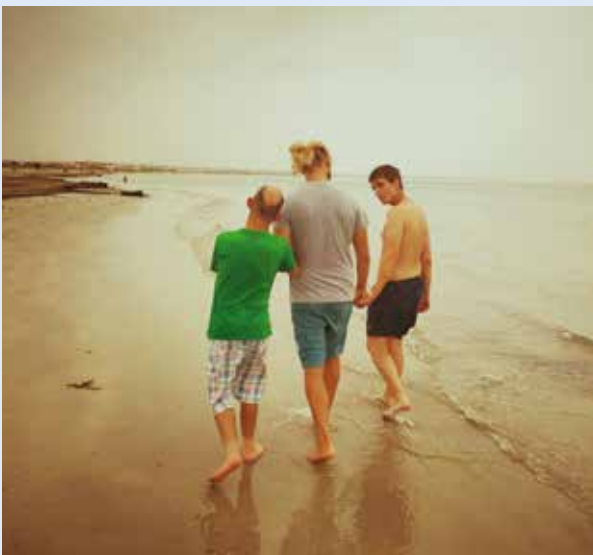
Pase por la playa cercana a Fundamifp