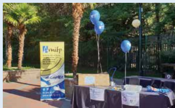
Stand de AMIFP durante el día en el Parque de atracciones

Allí ofrecimos información de la entidad, dando a conocer nuestro catálogo de servicios y programa a todas las visitantes interesados que se pasaron por nuestro stand. El parque de atracciones se dispuso como el escenario perfecto para difundir nuestra labor solidaria. Los globos azules de AMIFP cubrieron todo el horizonte en un día de lo más significativo y que nos sirvió enormemente para darnos a conocer entre aquellos que confían en nuestra labor de ayuda a la mejora de calidad de vida de las personas con capacidades diferentes y sus familias. Desde aquí agradecemos a todos/as vuestra participación y todo vuestro interés prestado hacia AMIFP.