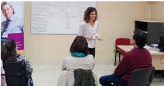
La profesora de inglés con los participantes durante una de las sesiones del curso

Hoy en día, el inglés es una formación básica que potencia enormemente el desarrollo personal y profesional. Cada vez más, este idioma es muy necesario para el desempeño laboral del día a día. Desde AMIFP estamos trabajando para que se pueda seguir llevando a cabo otros cursos de idiomas en un futuro próximo.