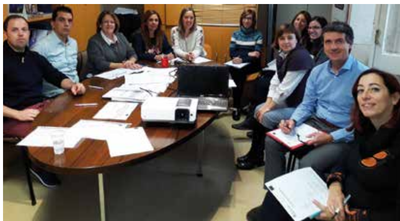
Trabajadores de AMIFP y de la Residencia FUNDAMIFP el día del curso de "Generando Cambios"

Esta formación se complementa con la gestación en AMIFP de un nuevo y próximo Servicio multidisciplinar de Mujer y Discapacidad. La idea de creación de esta nueva área se ha estado fraguando desde el 2017, año en el que tuvieron lugar las "Jornadas de Género y Discapacidad" de AMIFP.