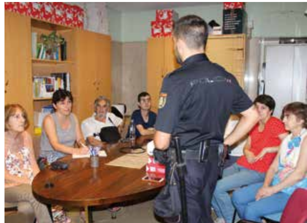
Integrantes del taller Seguridad en la Red

Durante la hora y media de sesión, el 18 de septiembre pasado, aprendimos a preservar los datos en la red y a navegar por Internet con las precauciones necesarias.