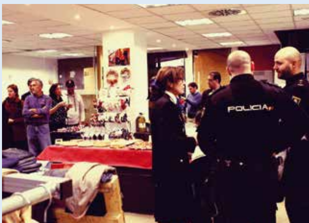
Foto del día de Inauguración del Mercadillo Solidario