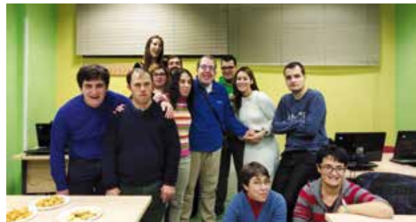
Integrantes del curso de Ofimática junto a la profesora y una de nuestras voluntarias

El último día de esta primera parte del curso, además, realizamos un aperitivo navideño y escuchamos divertidos y emotivos villancicos para despedir el curso. En la segunda parte esperamos continuar nuestro recorrido informático aprendiendo a utilizar Microsoft Excel, Access y también tendremos un primer acercamiento al diseño del Currículum vital.