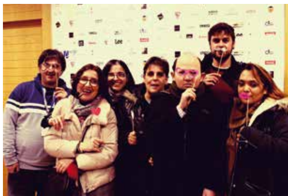
Nuestros participantes del Club de Ocio asistieron al Mercadillo junto a dos voluntarios

Desde la Asociación a favor de las Personas con Discapacidad de la Policía Nacional agradecemos a todos aquellos que han participado, de una forma u otra, en este evento. En AMIFP, cada pequeña ayuda es un paso más para allanar el camino de muchas personas a las que nuestra asociación presta servicio.