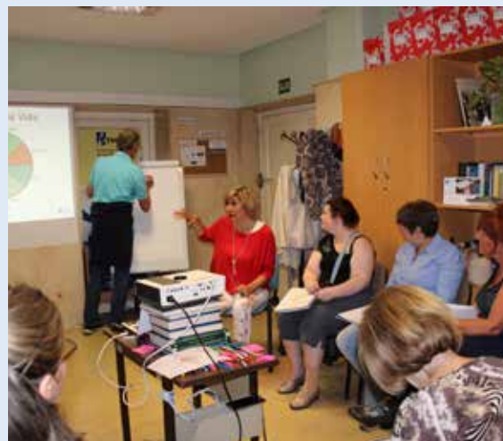
Participantes del curso de Coaching

Plena Inclusión con su Programa de Apoyo a Familias cofinanció esta actividad y nos sigue apoyando para que sigamos realizando talleres que inciden en la mejora de la calidad de vida familiar.