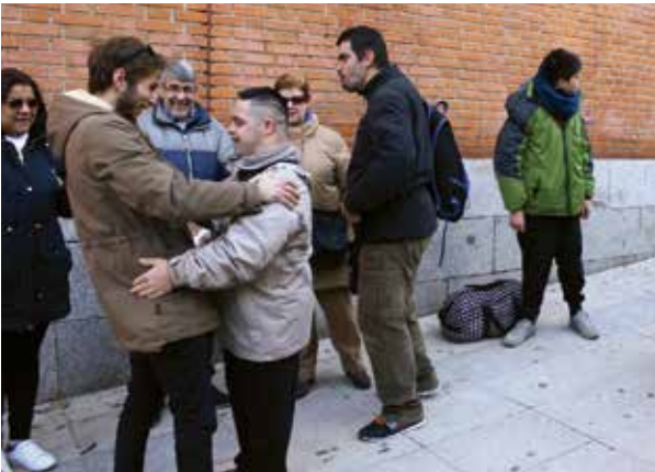
Reencuentro entre monitores y familias antes de la salida a Guardamar

La Residencia Fundamifp lleva más de 25 años apostando por la organización de actividades de ocio y tiempo libre en este emplazamiento playero de Santiago de la Ribera. Tanto la Fundación como la Asociación comparten el compromiso de asegurar el ocio y descanso de las personas con discapacidad y sus familias.