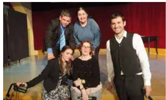
El reparto posa junto a una de nuestras beneficiarias

Desde el Servicio de Psicología se ha impartido la charla-coloquio "Corazas emocionales" que creó un espacio de autoreflexión, donde los participantes tuvieron la oportunidad de realizar una introspección, conocerse a sí mismos y descubrir qué corazas desarrollan de manera inconsciente para proteger su intimidad.