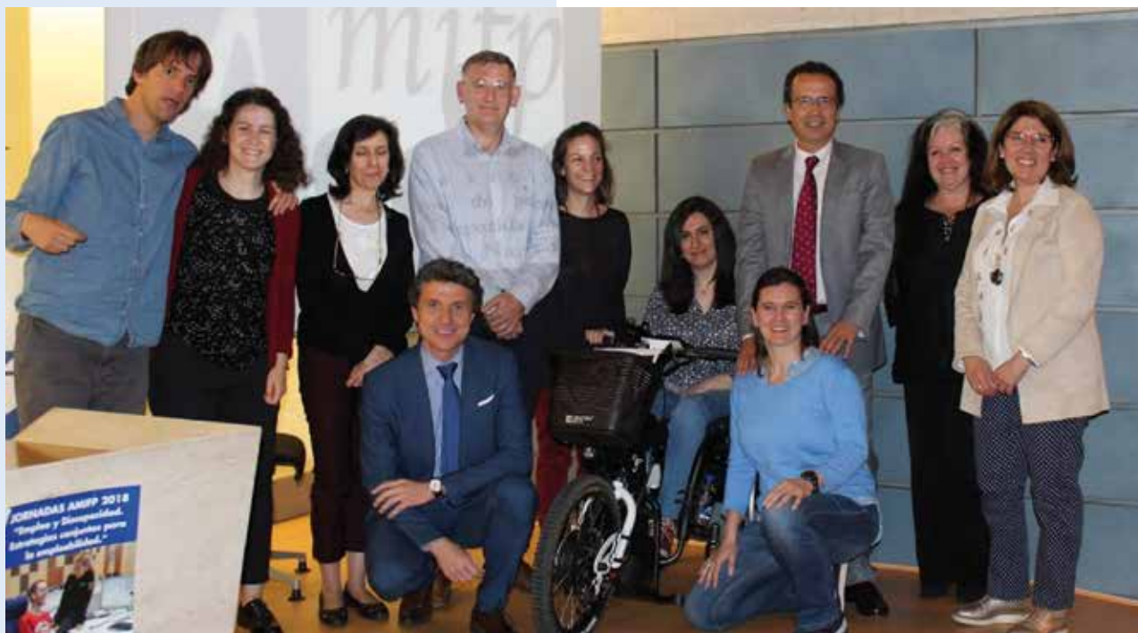
Foto de los ponentes que participaron durante el segundo día de las Jornadas Amifp 2018

los beneficios del teletrabajo y el éxito en la implantación de este método en los denominados call centers. Y, por otro lado, el emprender puede ser la vía de escape de muchos trabajadores asalariados. Conocer las dificultades a las que se enfrentan y contar con el apoyo en todo el proceso de formación de nuevos negocios resulta de vital importancia en el desarrollo de las ideas.