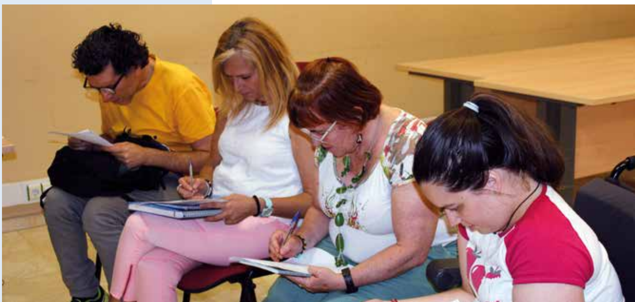
El grupo de inglés toma apuntes en una de las clases celebradas en este semestre.

Amifp ofrece un curso de formación en idiomas adaptado y accesible para personas con cualquier tipo de discapacidad. El objetivo es mejorar la empleabilidad de las personas con discapacidad.