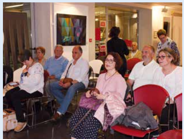
Asamblea General Ordinaria de Amifp

Las buenas prácticas de Amifp colocan a la asociación como una de las entidades confiables de referencia a nivel estatal en materia de cualquier tipo de discapacidad.