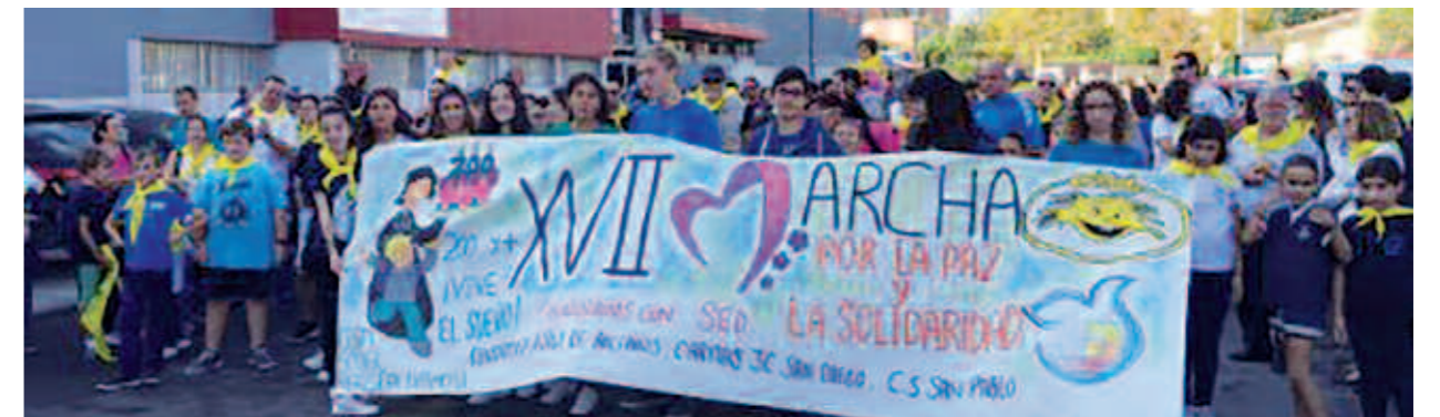
Participantes en la marcha

una eucaristía y en la plaza Héroes de Cavite se juntaron para recaudar fondos destinados a diferentes entidades como el asilo de ancianos, Cáritas Juvenil, Solidaridad, Educación y Desarrollo en el Tercer Mundo, Residencia Fundamifp y otros centros. Tabá a hacer realidad nuestros sueños.