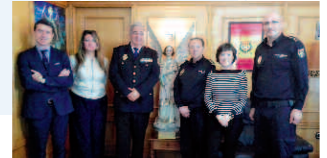
Fernando Amo, Jefe Superior de Policía del País Vasco junto a representantes de AMIFP y miembros del CNP

El próximo semestre organizaremos otras actividades en diferentes ciudades, esperando contar con el mayor número de participantes posible.