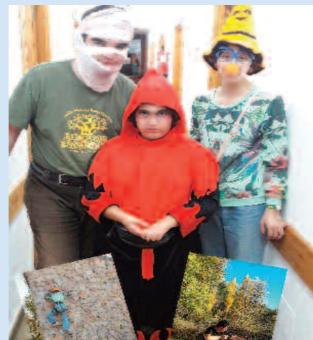
Participantes en la convivencia

El tiempo nos acompañó para disfrutar de un fin de semana cálido y otoñal en la sierra de Madrid, realizando actividades de multiaventura, como tiro al arco y escalada, paseos con la naturaleza, fiesta de disfraces y compartiendo nuestro tiempo con otras personas con discapacidad de diferentes Asociaciones.