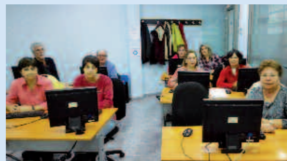
Asistentes al curso

Entendemos las nuevas tecnologías como facilitadoras de la integración social de la comunidad, destacando la importancia de su uso responsable.