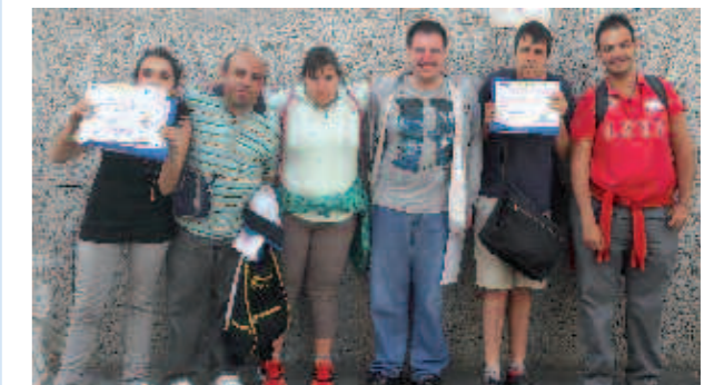
Participantes en el curso

Este curso forma parte del programa de formación del SIL de AMIFP, Servicio de Inserción Laboral. Su objetivo es potenciar el conocimiento y uso de las nuevas tecnologías para que las personas con discapacidad intelectual se desenvuelvan de forma autónoma en la búsqueda de empleo.