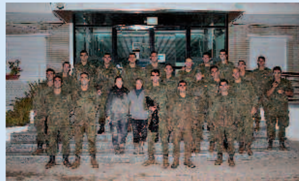
Grupo de voluntarios y colaboradores