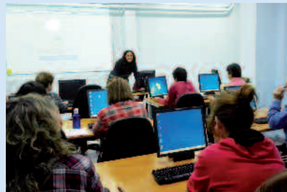
Asistentes al curso

El objetivo era que padres y cuidadores de primer orden tuvieran la oportunidad de aprender y manejar correctamente las nuevas tecnologías contenidas en los dispositivos smart (tablets, móviles) y la informática a nivel usuario.