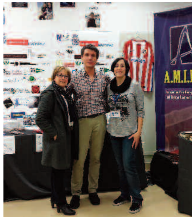
Trabajadores de AMIFP junto a uno de los patrocinadores

Mercadillo Solidario 17, 18, 19 y 20 DE NOVIEMBRE HORARIO: 10:00 - 21.00 h. LUGAR: C/CEA BERMÚDEZ, 50 Metro: Islas Filipinas