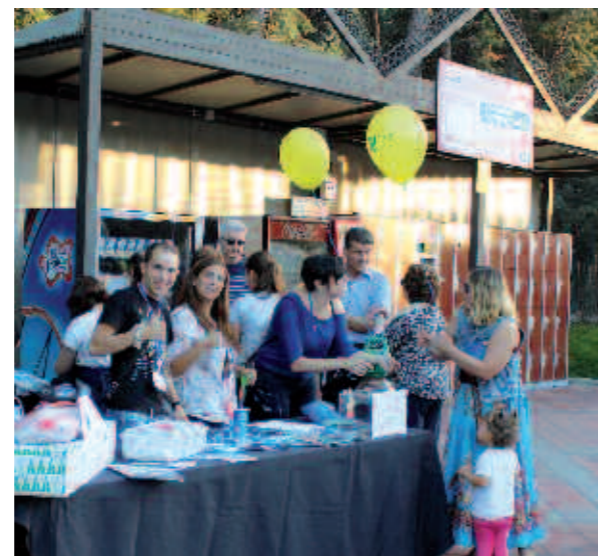
Trabajadores de AMIFP en una de las mesa informativas

Agradecemos a todos/as vuestra participación y que la jornada fuera una agradable celebración.