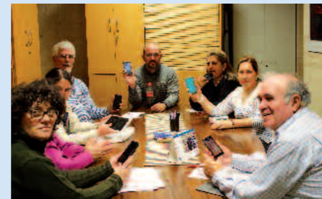
Participantes en el curso

Informamos de que la Fundación Vodafone y Pantallas Amigas ponen a disposición herramientas tecnológicas para que sigamos aprendiendo.