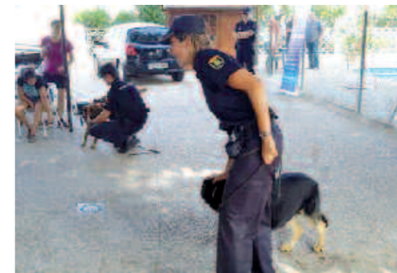
Un momento de la exhibición

Los usuarios de la Residencia Fundamifp pudieron también ver de cerca las furgonetas y dos motocicletas de la Unidad de Prevención y Reacción, atendidos por varios Policías. Esta Unidad, dedicada básicamente al orden público, realiza también labores de prevención mediante charlas a jóvenes sobre temas como el acoso escolar, redes sociales, o estupefacientes, entre otros.