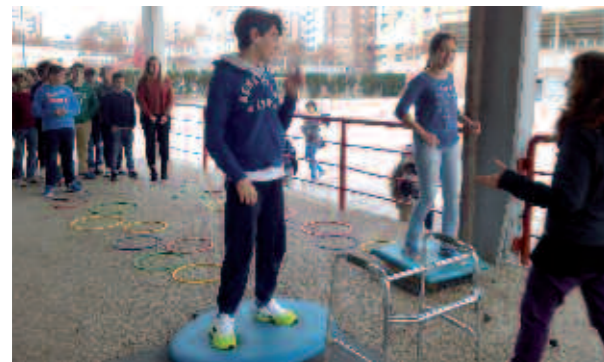
Alumnos del Colegio Maristas

Con estas jornadas, celebradas los días 9, 10 y 11 de Diciembre, con alumnos de 1º y 2º E.S.O, y al igual que ya hemos hecho en distintos colegios del Municipio de San Javier, tratamos de potenciar, fomentar y apoyar la construcción de un modelo inclusivo en las escuelas y colegios. En definitiva, una educación inclusiva que garantice el aprendizaje y la participación de todos los estudiantes.