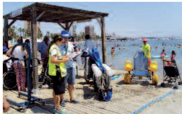
Actividad en la playa

Con este circuito tratamos de acercar y sensibilizar a los alumnos con la discapacidad física. Para ello, recorren un circuito que consta de obstáculos que dificultan su marcha, así como adaptaciones para que puedan comparar y ponerse en el lugar de las personas con discapacidad física. Al finalizar se realiza una reflexión sobre los miedos, sentimientos, inquietudes que hayan podido sentir durante el recorrido del circuito y que puedan llegar a apreciar las barreras con las que se encuentra una persona con discapacidad al realizar las AVD.