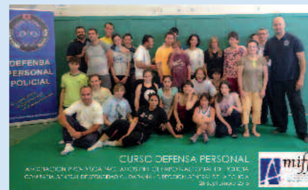
Participantes en el seminario

Seminario de Defensa Personal Policial realizado para AMIFP, la Asociación Pro-Discapitados de la Policía Nacional.