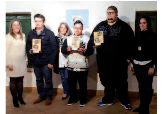
Premiados en el concurso