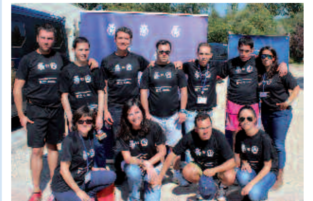
Trabajadores de AMIFP junto con algunos participantes

¡¡Aún estás a tiempo de adquirir tu camiseta solidaria!!