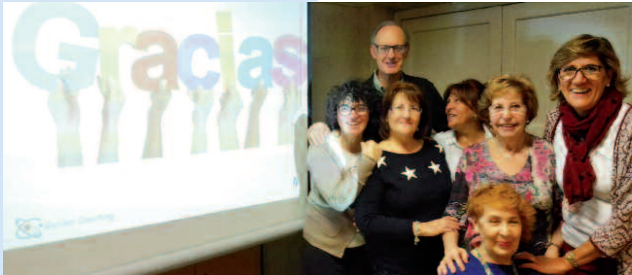
Asistentes al curso

La metodología utilizada ha sido muy participativa y práctica, con dinámicas Role play, ejercicios de corporalidad y trabajos en grupo.